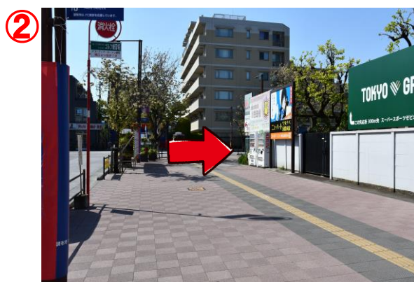
② 横断歩道を渡らずに右へ曲がり歩道橋が見えるまで道なりに進みます。