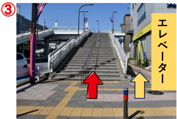
③ 階段を上がります。⇒階段は④～⑥へエレベーターを使用の方は歩道橋右側の点字ブロックに沿って進みます。⇒エレベーターは⑦～⑩へ