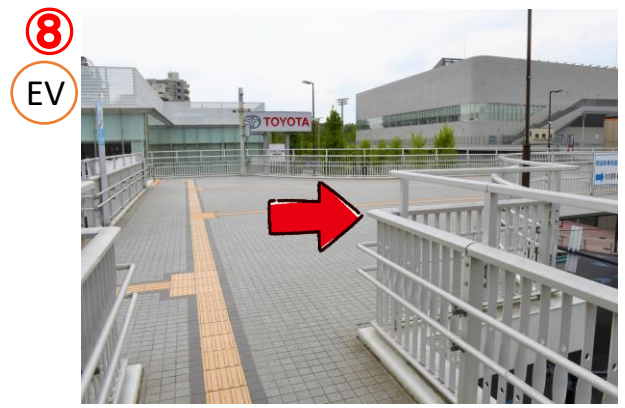
エレベーターを降りたら右へ進みます。