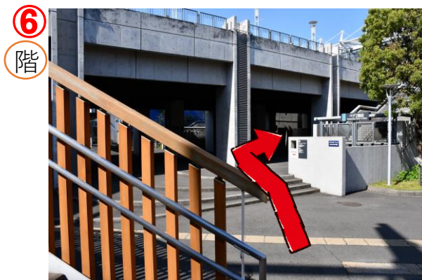
⑥ 階段を降りたら矢印の方向へ向かいます。