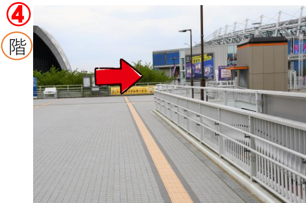
④ 歩道橋突き当たりを右へ曲がります。