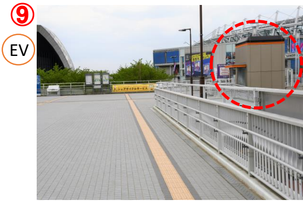
右手にあるエレベーターに乗って1階へ降ります。