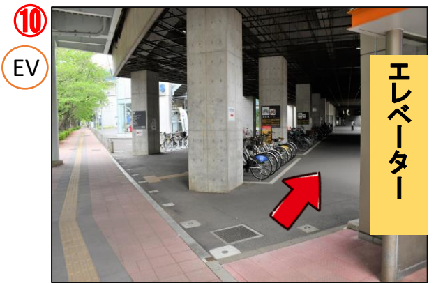
エレベーターを降りて右後方矢印の方向へ真っ直ぐ進みます。