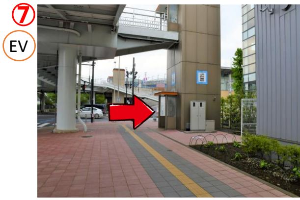
エレベーターに乗り2階へ上がります。