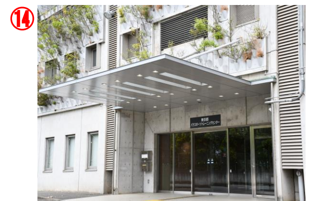
到着です！ ご利用お待ちしております！！