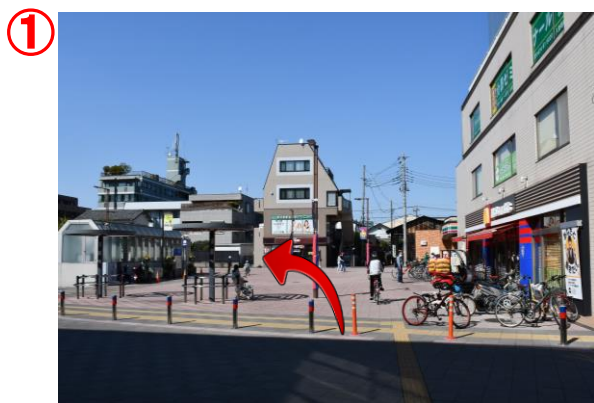
① 京王線 飛田給駅北口のロータリー沿いを反時計回りに進みます。