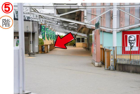
⑤ 木目調の階段を降ります。