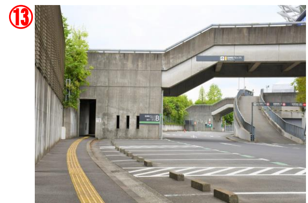
この風景が見えたらもう少しです！