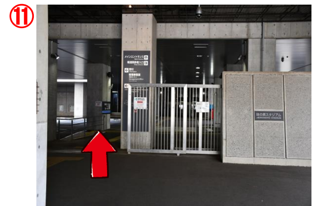
中央門へ向かいます。